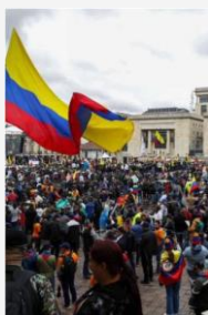
En la Plaza

La violencia contra los liderazgos locales, especialmente aquellos que se postulan para cargos públicos, es motivo de especial preocupación. La Fundación Ideas para la Paz (FIP) reportó que el 25 por ciento de los líderes y lideresas encuestados en 48 municipios, informaron haber recibido amenazas, un aumento desde junio de 2023.